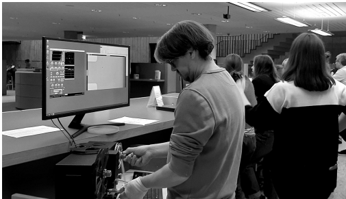
Abb. 3: Offener Werkstatt-Termin „Buntes Rauschen von der Rolle lassen“ an der Digitalisierungsbar.

noch nicht ganz ausgeschöpft ist. Die Erhebung, die im Kontext einer allgemeinen Erhebung zur Mediennutzung stattgefunden hat, dokumentiert zwar eine hohe Zufriedenheit mit den Angeboten (9,7 bzw. 9,1 von 11 Punkten für Podcast- bzw. Greenscreenstudio), stellt jedoch fest, dass der Bekanntheitsgrad erwartungsgemäß bei den Studierenden höher ist als bei den landesbibliothekarischen Nutzenden (Podcaststudio: 44,7 % bzw. 33,2 %; Greenscreenstudio: 38,2 % bzw. 25,3 %) und dass dieser mit zunehmendem Alter abnimmt. Der Umfragezeitraum lag zwischen dem 30.9.2024 und dem 20.10.2024, also ca. 18 Monate nach Eröffnung der Studios und keine drei Monate nach Eröffnung des gesamten Mediatheksbereichs. Hier sind sicher noch Synergieeffekte zu erwarten, die durch weitere Maßnahmen gestützt werden.