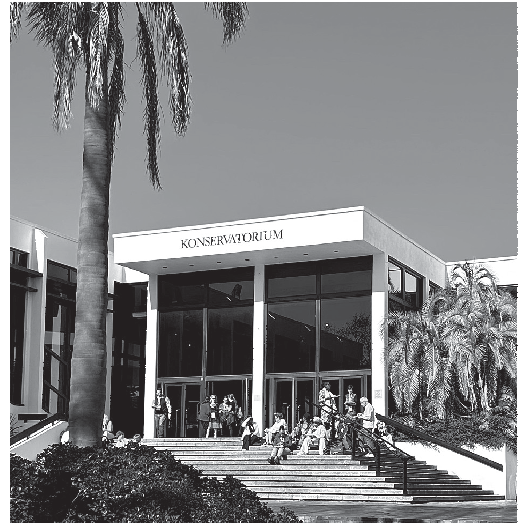
Abb. 3: Kongressteilnehmende beim Light Lunch.

kumentiert man Musik aus rituellen Kontexten, wenn der Ritus und seine Musik nur bestimmten Personen zugänglich sein darf und eine Forscherin aufgrund ihres (jungen) Alters beispielsweise selbst eigentlich keinen Einblick erhalten darf?