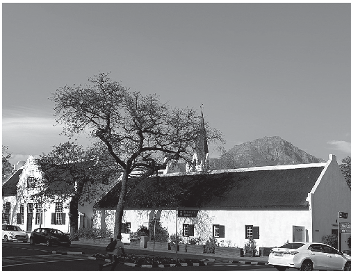
Abb. 1: Stellenbosch im Juni 2024.

Je nach Wetterlage und Windrichtung erlaubt die Landung am Flughafen von Cape Town einen Blick auf den berühmten Table Mountain und die Gebirgsregion, die auch das Umland um Stellenbosch prägt. Nach einer fast 24-stündigen Reise (von Haustür zu Haustür) war es etwas unwirklich,